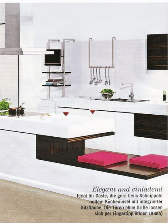
Elegant und einladend Ideal für Gäste, die gern beim Schnippeln helfen: Kücheninsel mit integrierter Sitzfläche. Die Türen ohne Griffe lassen sich per Fingertipp öffnen (Alma)