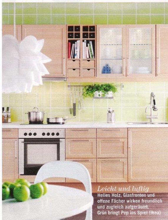
Leicht und luftig Helles Holz, Glasfronten und offene Fächer wirken freundlich und zugleich aufgeräumt. Grün bringt Pep ins Spiel (Ikea)